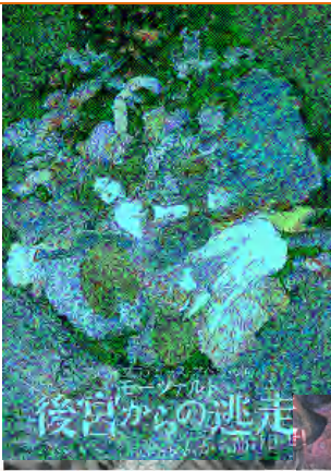
錦織健プロデュース Vol.6

スペイン貴族の娘コンスタンツェと侍女のブロンデ、コンスタンツェの恋人ベルモンテの従僕であるペドリロの3人が海賊につかまり、太守セリムに売られた。ペドリロからの手紙を見て救出に向かう青年貴族ベルモンテ。太守の後宮に着くと、かなり年配のオスミンがいて、ブロンデに横恋慕して、ペドリロを邪魔にしている。太守セリムもコンスタンツェを妻にと望む。